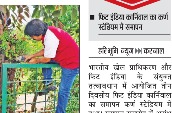
ट्री गार्ड हटाकर पेड़ों को राहत देते लक्ष्य जनहित सोसाइटी के सदस्य।