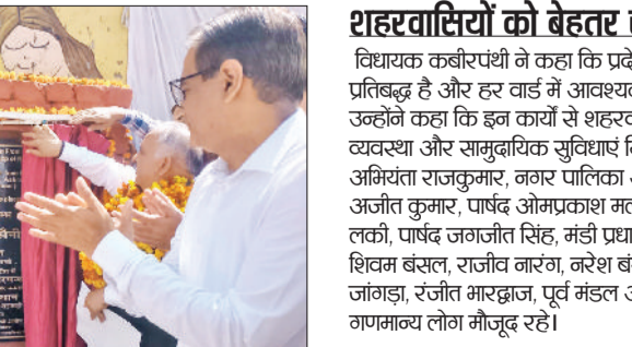
करनाली गेट क्षेत्र में योगा शो व स्टील रेलिंग, वार्ड 4 में सड़क व ड्रेन निर्माण, सरकारी स्कूल के पास चौपाल का निर्माण, वार्ड 9 में सड़क निर्माण, वार्ड 3 में

वार्ड 11 में मैस्टिक एस्फाल्ट सड़क निर्माण, विभिन्न वार्डों में