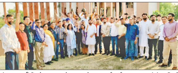
अंबाला। शहीदों को नमन करते भाजपा नेता व कार्यकर्ता।