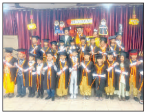
ग्रेजुएशन सेरेमनी के दौरान नरह छात्र।