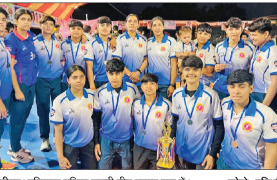
पानीपत। हरियाणा महिला कबड्डी टीम प्रसन्न मुद्रा में।