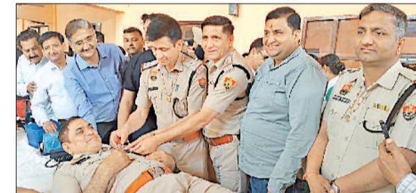
बराड़ा। रक्तदानियों को सम्मानित करते हुए मुख्यातिथि व अन्य।

शहीद दिवस के अवसर पर प्रयास समाज सेवा संस्थान द्वारा अग्रवाल धर्मशाला में शहीदों को समर्पित एक स्वेच्छिक रक्तदान शिविर का आयोजन किया गया। शिविर में क्षेत्रवासियों ने बड़-चढ़कर भाग लेते हुए कुल 65 यूनिट रक्तदान किया। संस्था के प्रवक्ता राकेश कौशिक ने बताया कि यह शिविर प्रयास के वरिष्ठ सदस्यों जंगबीर