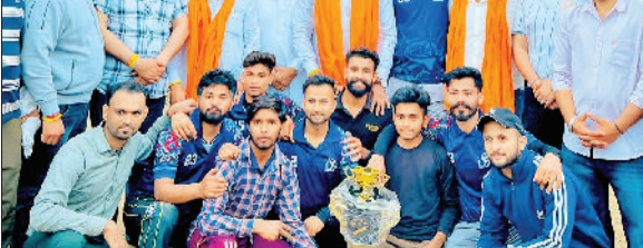
शहजादपुर। प्रतियोगिता की विजेता टीम।