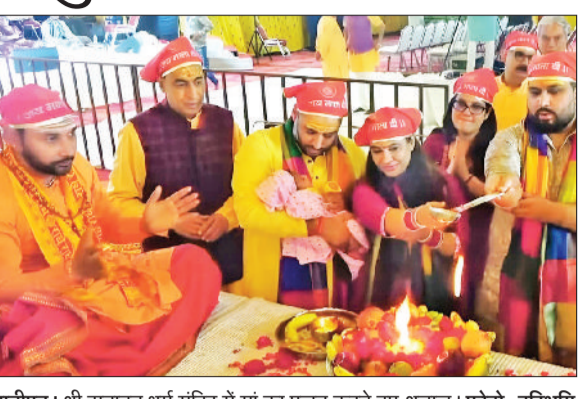
पानीपत। श्री सनातन धर्म मंदिर में मां का पूजन करते हुए श्रद्धालु।