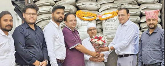
पानीपत। डेरा बाबा जोध सचिचार गुरुद्वारा में सीमेंट लेकर पहुंचे जेएसडब्ल्यू सीमेंट कंपनी पदाधिकारी।