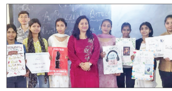
पानीपत। आईबी कॉलेज के विजेता विद्यार्थी।

शहीद ए आजम भगत सिंह, राजगुरु और सुखदेव के शहीदी दिवस पर हरियाणा ज्ञान विज्ञान समिति और शहीद भगत सिंह युथ ग्रुप राक्सेडा के तत्वावधान में सिंबलगाढ़, बुढनपुर तथा बसेड़ा में मशाल जुलूस निकाला कर बलिदानियों को नमन किया गया। मशाल जुलूस के माध्यम से युवाओं से देश, समाज और मानवता की सेवा करने की अपील की गई। वहीं, सिम्बलगाढ़ में प्रधान दीपक, ज्ञान विज्ञान समिति युनिट के प्रधान अनुज, कर्म सिंह ने मशाल में अग्नि प्रज्वलित कर जुलूस की