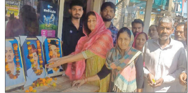
पानीपत। शहीदों को नमन करते हुए फैला उजियारा फाउंडेशन सदस्य।