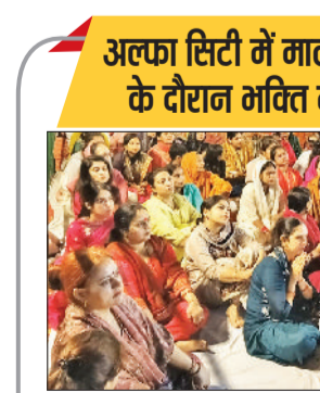
करनाल। अल्फा सिटी में माता रानी की चौकी के दौरान भजन प्रस्तुति देते गायक व उपस्थित श्रद्धालु।

अल्फा सिटी में माता रानी की मय्य चौकी के दौरान भवित में सराबोर हुए भगत