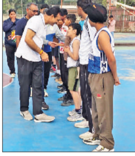
करनाल। कर्ण स्टेडियम में फिट इंडिया कारनिवाल के समापन अवसर पर उपस्थित अतिथिगण।