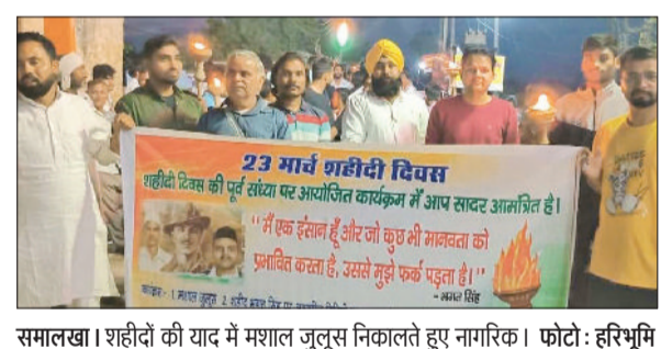
समालखा। शहीदों की याद में मशाल जुलूस निकालते हुए नागरिक।