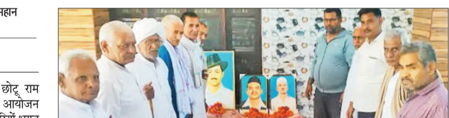
पानीपत। इसराना गांव में शहीदों को नमन करते हुए किसान।