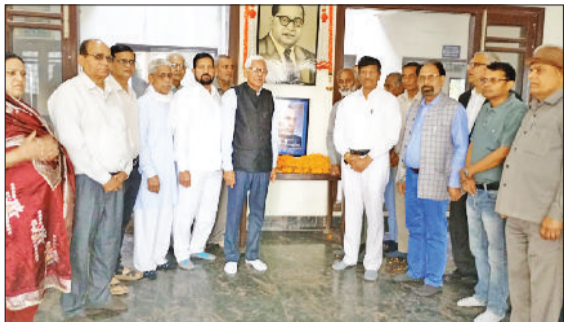
करनाल। कार्यक्रम में मौजूद गणमान्य व्यक्ति।