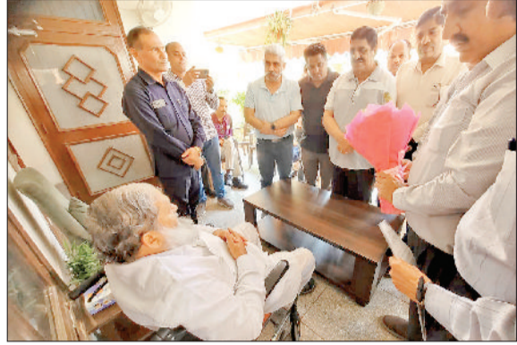
अंबाला। साइंस कारोबारियों से मुलाकात करते मंत्री अनिल विज।

हरिभूमि न्यूज अंबाला ईरान अमेरिका युद्ध से साइंस इंडस्ट्री में व्यवसायिक गैस का संकट पैदा हो गया है। इस संकट से कारोबारी बेहद परेशान हैं। युद्ध की वजह से करोड़ों के ऑर्डर फंसे व शिपिंग कंपनियों के सरचार्ज बढ़ाए जाने से कारोबारी पहले ही बेहद परेशान थे। अब व्यवसायिक गैस के संकट ने उनकी मुसीबतों में बढ़ाती कर दी है। समस्या के समाधान को लेकर सोमवार को कारोबारियों ने उर्जा एवं कारोबारी बेहद परेशान, मंत्री अनिल विज से मुलाकात की। मंत्री ने प्रदेश के उच्च अधिकारियों को समस्या के त्वरित समाधान के निर्देश दिए हैं।