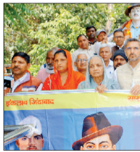
करनाल। शहीदी दिवस पर आयोजित सभा में शहीदों को श्रद्धांजलि देते कर्मचारी संगठन के सदस्य।

वक्ताओं ने कहा कि शहीदों की कुर्बानियां देश के लिए अमूल्य हैं और युवा पीढ़ी को उनके आदर्शों